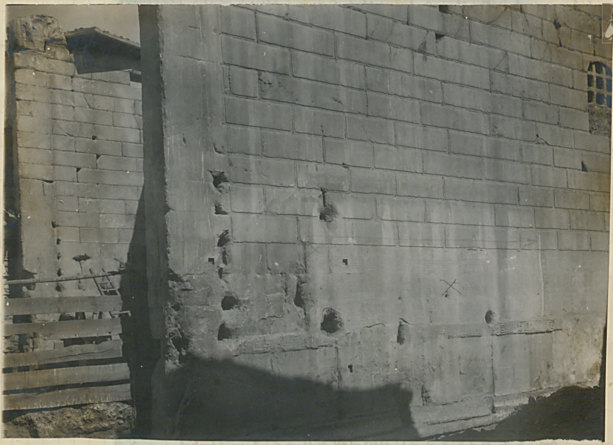
تصویری از تخریب‌های وارده بر دیوارهای بناهای تاریخی در تبریز