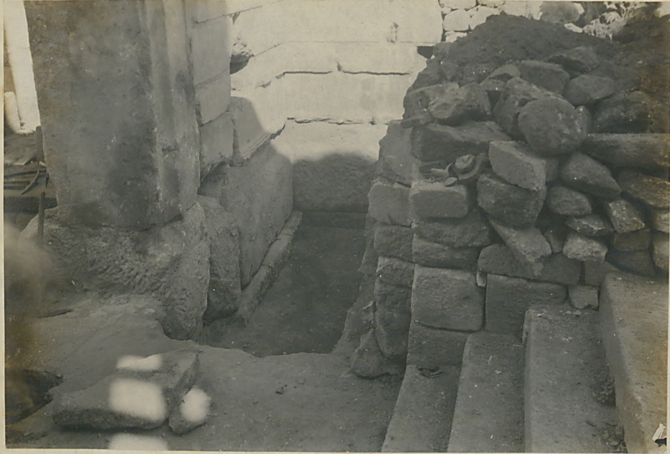
تاعرس جاسنك يايلايه عفرات ديتراش دو شه لرمك نومرد ۱۰