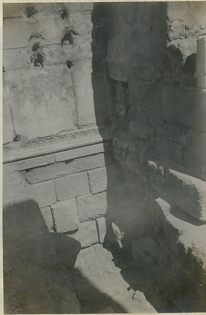
عمارتده یا بیلکله سوارسی عرصه ایدر کم که ، معبدک سلمی وودیتور کطنده یا بیلکله سلمی ایونیک تقیم معاریه سلمی تابع اولیله ایجاب ایدر برقیه یوایده هکت علمیه سلمی سوره مدار اولیله سلمی بر دستم معاری کوراته ولو یاریم ۸ الیله اولیله لصادق ایلمتور .

عملیات انجام شده تاریخ رضا می الهیته المرحله ایدر ماهیتده بر اثره تصادق اولیاست . بالذکر بویوک قانسک یا ک طرفنده اولیج تجزیه قالمسه برانقره سلمی لیلدر ایدرک انقره حوزده نیکم اولونقندر . سلمی بر طرفنده الی سونلی بر معبد سلمی مرکی اولوب فرودتوننده یعنی صلا مصلی سلمی باشی صانمجهیر صله قانارلی یاریم قالیجه بر قارته تصویریه ده هاویده . طرفنده ( A یا N ) ک و ( P یا A ) نیک بر آرایه اولیله صورته ( AKYΣ ) ایلر ای عبارتده سی یازیلید . سلمی نیک طرفنده قصدجه آتشمه بر باسدر سلمی وارده . اغلب افعال ( تریانه ) عاید در . لهور ایساره کلبایه تحویل اولوفانه معابدک لکانه کانه سلمی مویاستده حتی ال اوفانه ک معاریه نه وارنجیه قادر تجزیه ایدر لیک کوریلور . بد سلمی تحقیقات انجامنده بر اثره دسترس اولیله سلمی طبیعی رابورم زیاده ویرم دن سوارسی عرصه ایدر کم که ، معبدک سلمی وودیتور کطنده یا بیلکله سلمی ایونیک تقیم معاریه سلمی تابع اولیله ایجاب ایدر برقیه یوایده هکت علمیه سلمی سوره مدار اولیله سلمی بر دستم معاری کوراته ولو یاریم ۸ الیله اولیله لصادق ایلمتور . معبدک سلمی صله هیئت المجموع ۶۶ عددی بولانه سوره دیا باسلفلرخ ال اوفانه بر یاریم سلمی قالمسه اولی سلمی نیک نه درم انقالات وخریباته مروضه قالیقی کورور . سوارسی ده مقام کدرانده عرصه ایلمک لازمده له مذیت سابقه نیک بر یادکاری و تارخی و تقیم لری حکمنده اولیله عملکرده قالیلمیه قدیم سید کرده ایدر نیک محاذ لری شمار ایدینه لکونجه بر مینور ، بولنده بر ایلمک سلمی واقعه سلمی صورته تأسیه موجدیتیه نیک بدل عاقبت کورسرمده در .