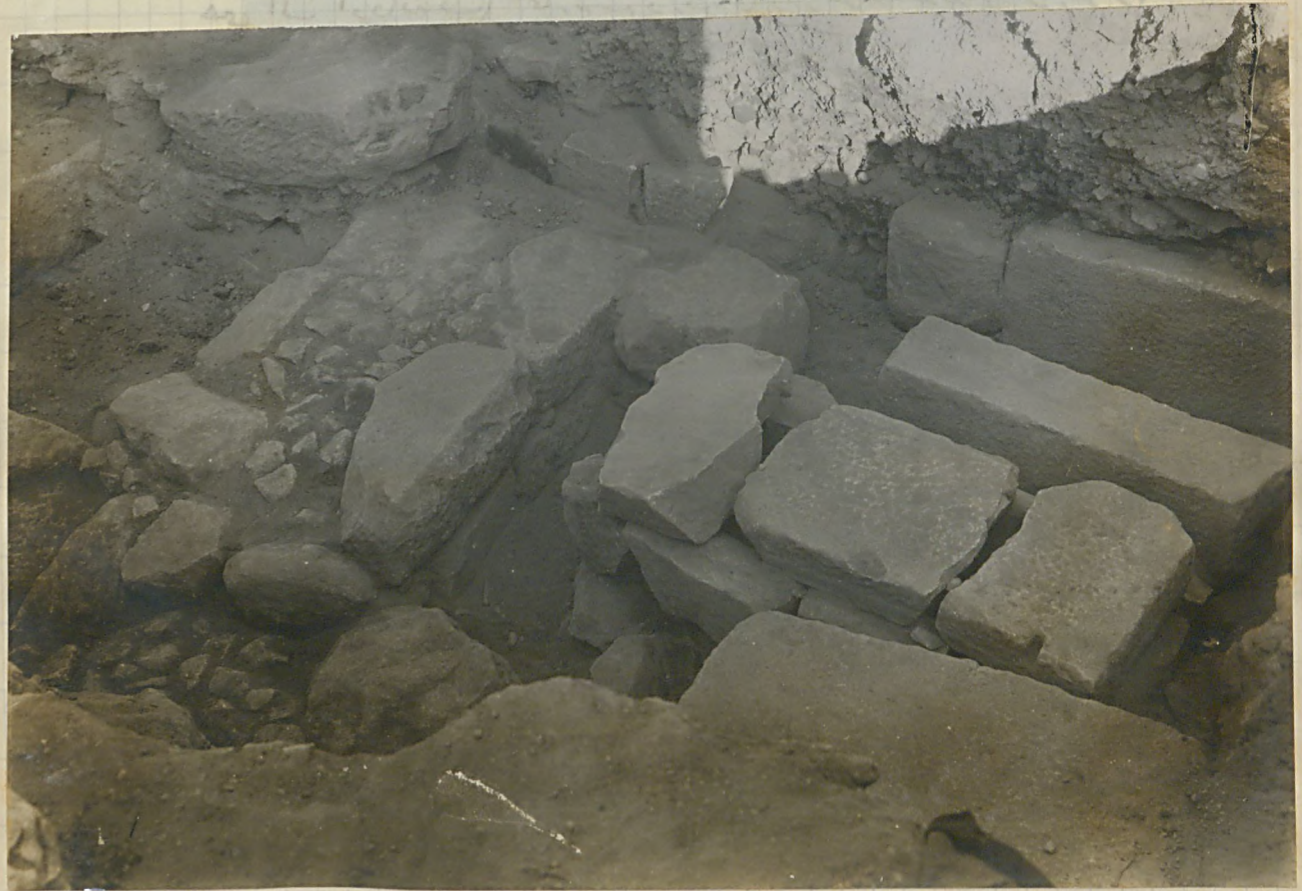
شده بهریتا بلده یا سینه هفتانده و بزانی سینه کوربهان ۷ نفره