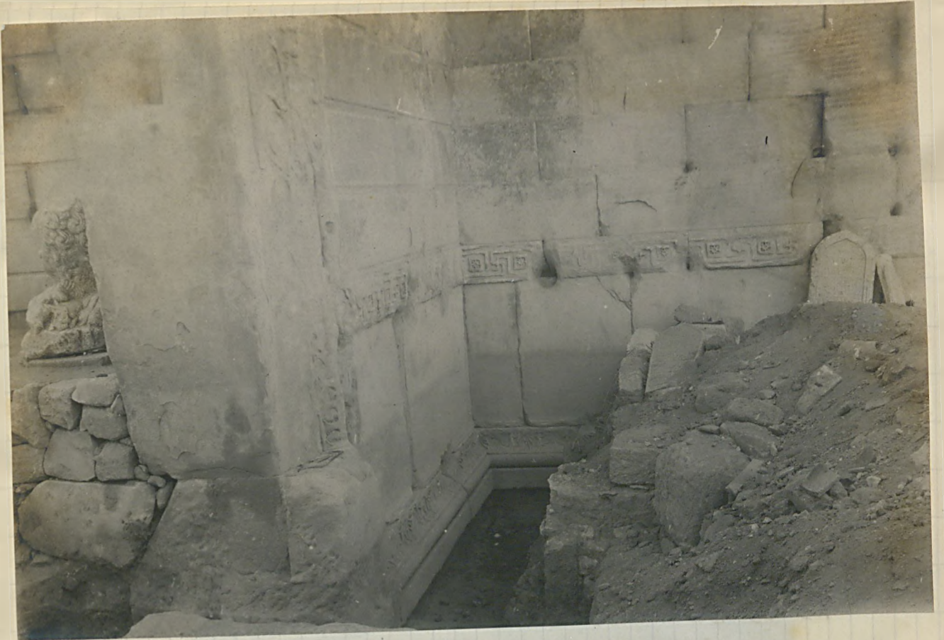
ملازه یا سینه سوندا ۶ نفره