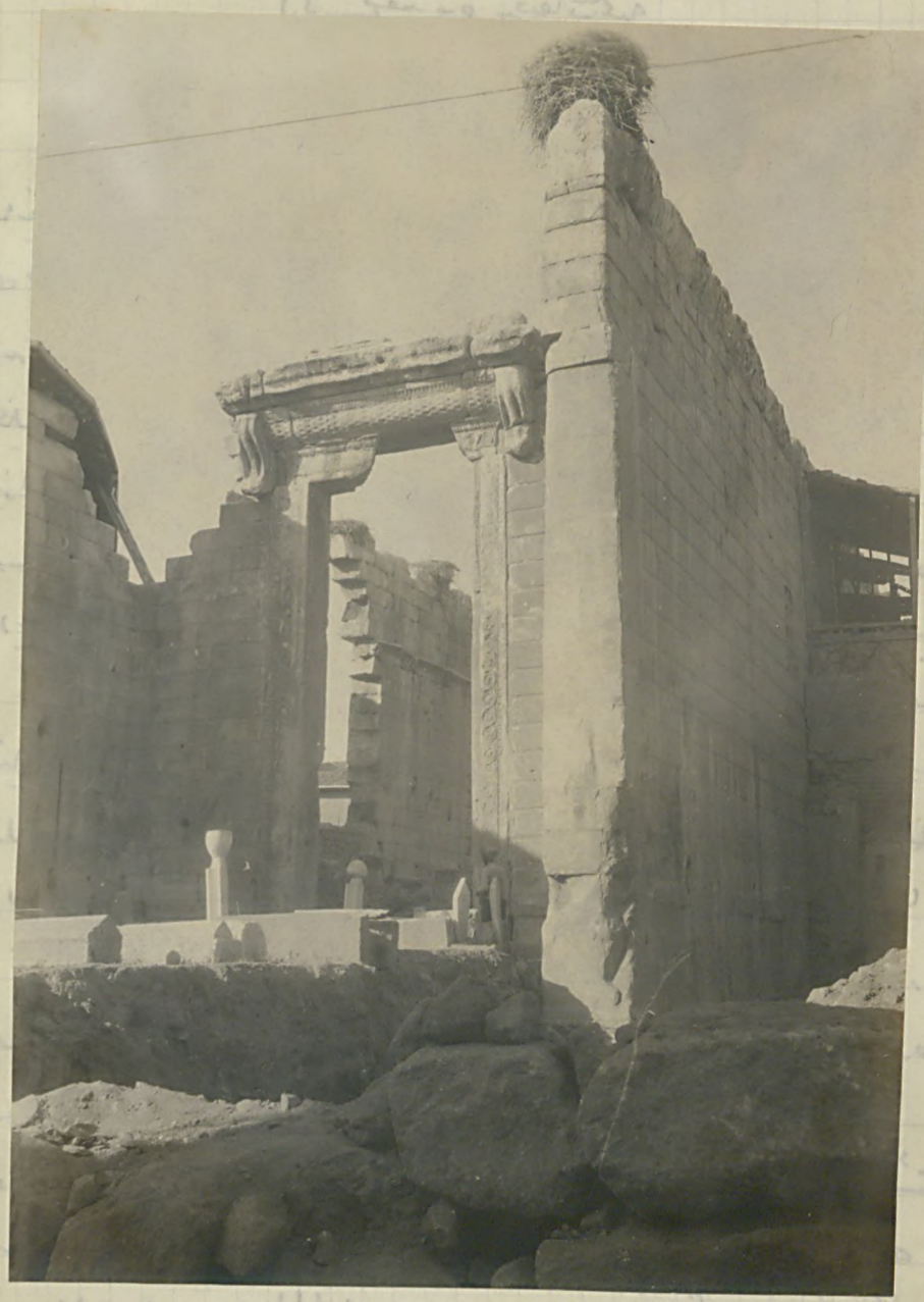
ایزدیه مبدک پروناغوس صهرک ۱

(Faint handwritten notes on the right margin of the page)