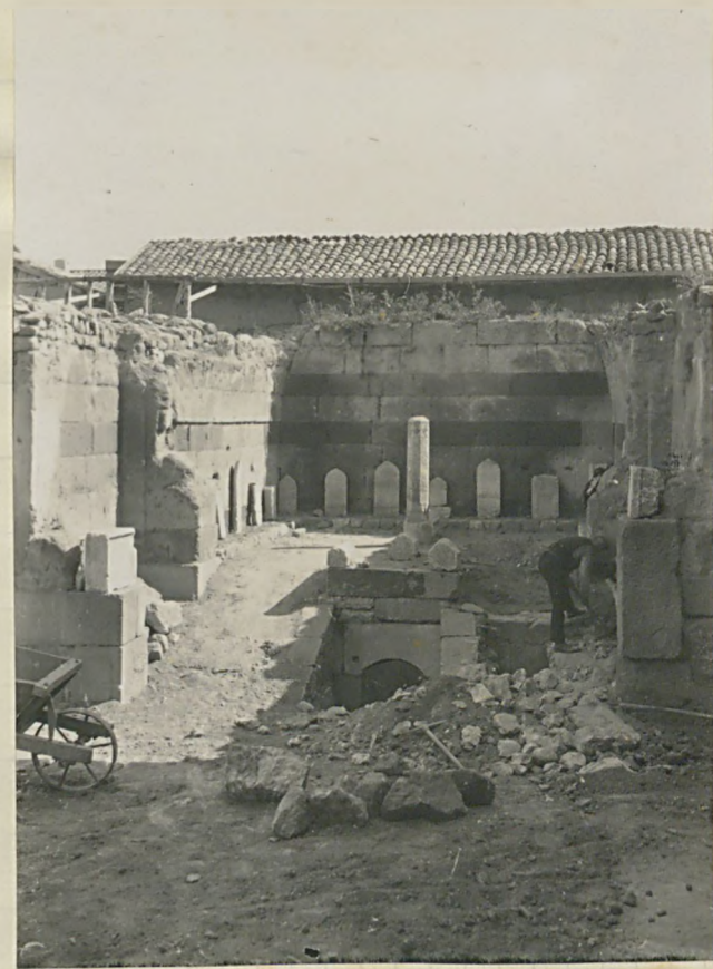
پیرانته طرفه « معبد » اریستور دوسم فسیه عیلاوه ادرناه آسید نومرد ۹