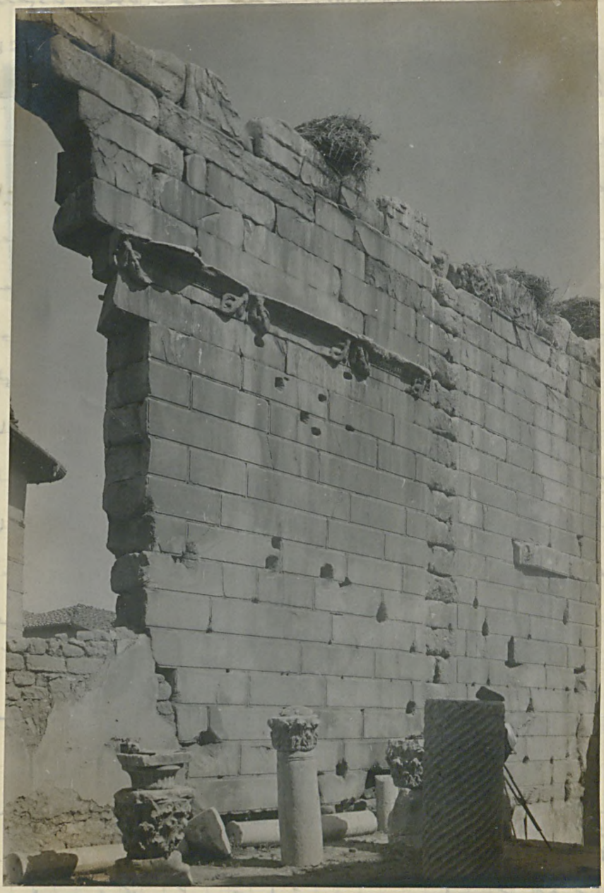
هلا ده كى خورلا تيزينا قى و طاي موزى ربارك (موزى ربارك) ايدم ههرايله ايدم ههرايله ايدم ههرايله (موزى ربارك) ايدم ههرايله ايدم ههرايله ايدم ههرايله

بروقور قزيم ر ، تدقيقاي برتا ياره تقيقه ايدرك موجود يه درونك قاز صده اولديغي تقيه ايدم ياره تيق ايمه قدر . برتوبه ماضي بدم طرفنده استولك ايله اولاه عرصه ترك هفرينه ههرايله و براره اوج متره درينك ايدرك سونك باصدين قاعده لر برر بولونشد . بر معبدك اني ايجره قولونده سرر ترك اوزاه مكدون هب ايله اولمى جريم تواقامى برلى عاري طاسكله قورولمدر . بو طاسكله فولى اعتبارله سون قوروجم قزمترايه رنده در . مع هذا ، بر هوقلى بقه يارنده قولونده ايجره سولمه و آزالرنده ههولمه بوسه برنده نيز اولد طرفنده اموات دفعه ايدله كورولمدر . (فيلو غراف نهدو V) تدقيقات موقعيله تمام بولويجه اويستوردموسى شنده سوندا عجمه زيم حاصل اولمدر . براره كهون اولر واردر . ياندا اوزاه قس ، هاجه بارام هاجه قوصك كهشيره نه عايد هانه ك باغچه نه نصارى ائمه اولديقمه صاحيله مهجه قائمده اوج بجه متره قدار قاز بگيمه يه ده براره ائمه ده كاملا سولمرك كلبك ايبه قس قزيمه ايجره بو عجمه ائمه بظنيله تيره رستوس