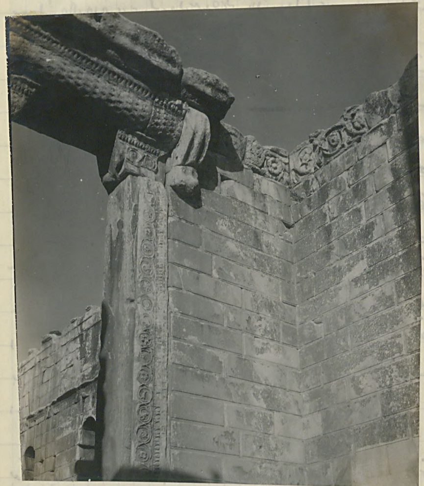
ناعوسه قايينك آنا بولور مياي مسمارى بولور

ميلادى بيلىنجه غولو بولور طرفنده انا اوجونام بولونك زمانك تا ائرمه نده فضله انا بولور ده حيرت اولديقه قائل اولور لازمكبر و بوتخيرات ره ، ميلادك درنجى عصرى اولور روغرى معبدك طيبا به خوينده باسار . ناعوسه مقال ديوار ، موضا طيبا راقنه رقت دريمك مقصديه قذف ايسر (فولور ايفي نهد) ۳ اديتور دوسى قسمة بولور ايسر ابيدى علاوه اولونديفن كى (فولور ايفي) ۹