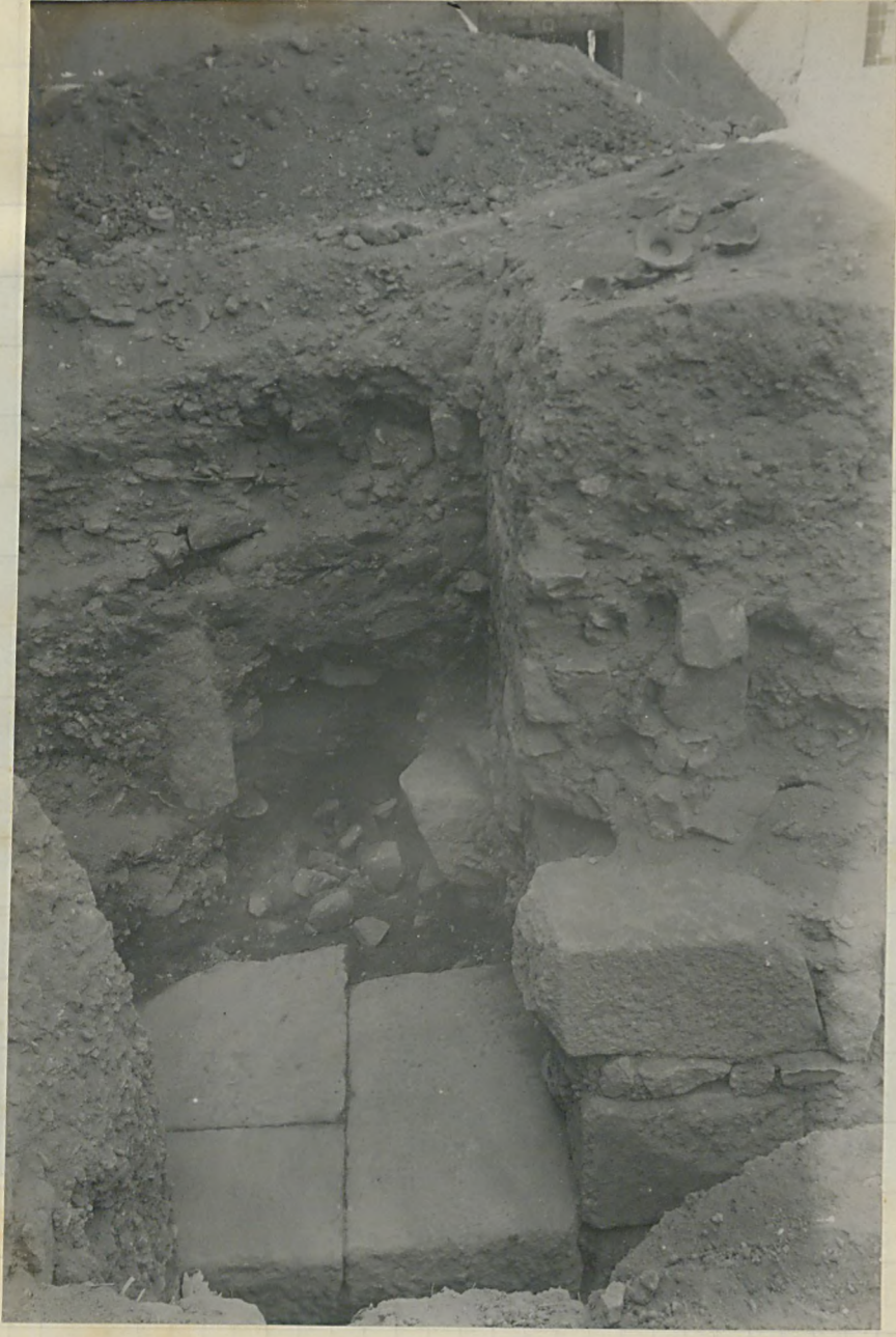
اوستو در موزه کی هفتانده کوربهان سینه قاعده کوی کهنه نند ۸ نفره